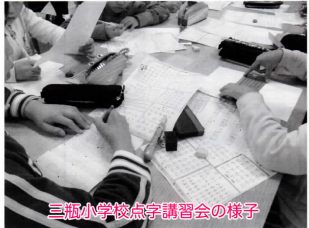
三瓶小学校点字講習会の様子