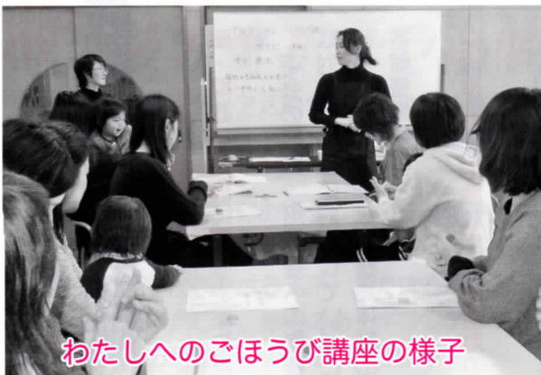
わたしへのごほうび講座の様子

地区社協育成事業、高齢者支援事業、生きがい活動支援通所事業、外出支援サービス事業、家族介護支援事業、給食サービス事業、ふれあいまちづくり推進事業等