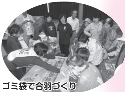
ゴミ袋で合羽づくり