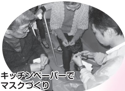
キッチンペーパーでマスクづくり