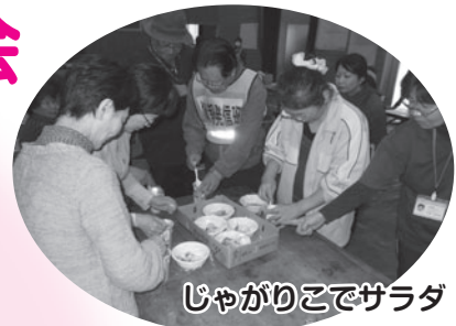
じゃがりこでサラダ