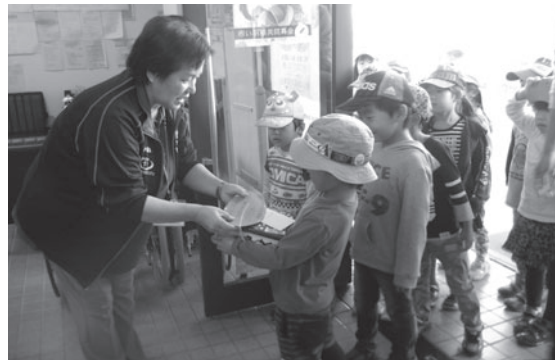
「うわまち南保育園」の園児の皆さんから、募金をいただきました。

『しづんの町を良くするしくみ』をスローガンに、十月一日から十二月三十一日までの三カ月間にわたり展開しました「赤い羽根共同募金運動」には、区長さんをはじめ、法人・個人・事業所・その他各種団体など、たくさんの方々から温かいご支援をいただき、心より厚くお礼を申し上げます。 お寄せいただいた募金は、一旦、愛媛県共同募金会に全額送金され、私たちのまち、西予市の地域福祉を推進するための事業費や、市町の枠を超えた広域的な課題を解決するための活動費として配分されます。 また、十二月一日から三十一日までの一カ月間にわたり展開しました「歳末たすけあい募金」にも、皆様の温かいご協力をありがとうございました。寄せられました義援金により、年末の時期に支援を必要とする方などへ配分を行わせていただきました。