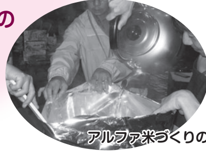
アルファ米づくりの実演