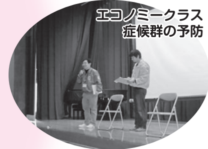
エコノミークラス 症候群の予防