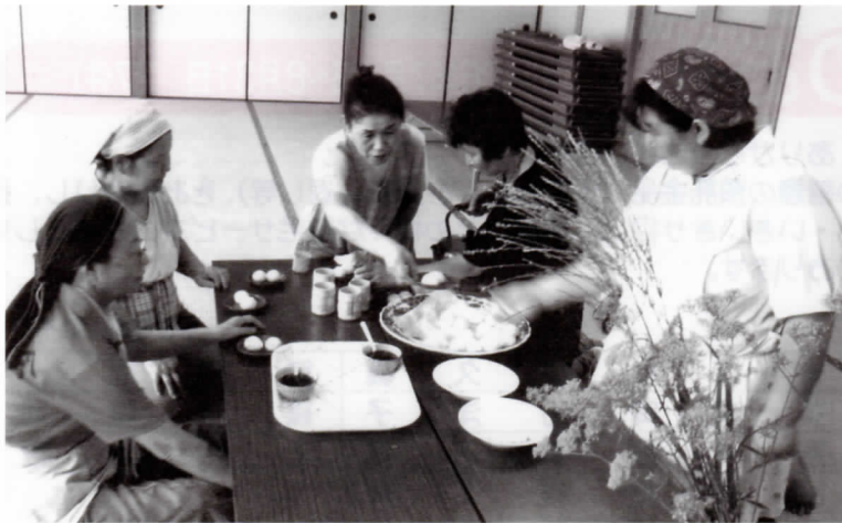
秋の「お月見饅頭」づくり