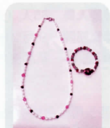
天然石のネックレス、小学生はインドビーズのブレスレット