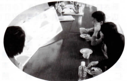
子供たちに絵本の読み聞かせ