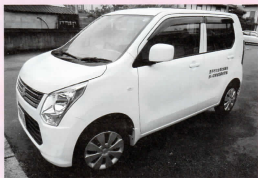
愛媛県共同募金会より、給食サービス事業の車輛として、西予市社会福祉協議会本所へ軽自動車の配分をいただきました。

また、12月1日から31日までは「歳末たすけあい募金」も行われますので、こちらも皆様のご協力をよろしくお願いたします。