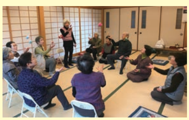
伊野窪地区(宇和町)のサロン

ふれあい・いきいきサロンの助成金には、地域の皆様からの「まごころ銀行」の預託金(寄付)などを活用しております。