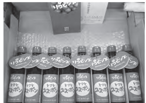
平成29年度は、城川町遊子川リコピンズの「トマトゆずポン」をお届けしました。