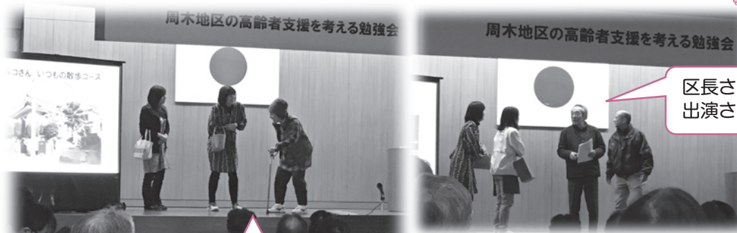
区長さんも出演されました

認知症高齢者の方が地域のみんなの支えによって住み慣れたところで住み続けることができることを理解していただくために、周木区をモデルにした劇を行いました。