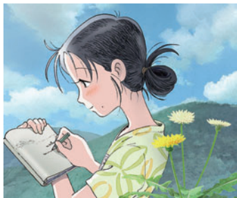
(C)この時代の双葉社/「この世界の片隅に」製作委員会