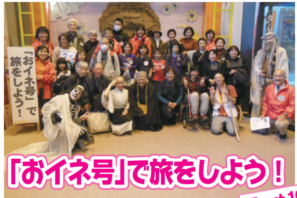
「お伊ネ号」で旅をしよう！

今回の旅は、平成二十八年十一月十九日（土）東温市の坊ちゃん劇場へ、約六十名が参加し「お遍路さんごっこ」のミュージカルを観劇しました。舞台は、お遍路の旅に似せられた四国の景色・名所が映し出され、とあるお寺の境内から始まり、参加者からは「迫力があり感動しました」「また、観に来たいです。」などの感想をいただきました。 ボランティアする人される人の隔たりはなく、参加者が交流を深めながら一緒に旅を楽しみました。