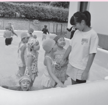
しろかわ保育所で子ども達のプールのお手伝い

これからも、たくさんの人に「夏休みチャレンジ☆ボランティア」に参加していただきたいと思います。