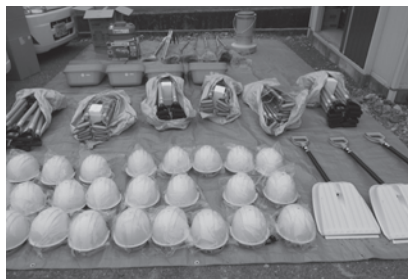
(本所) 大規模災害に備えた、ボランティアセンターの備品整備

皆様からお寄せいただいた募金は、西予市の福祉のために、大切に活用させていただいております。