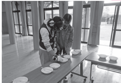
(城川) 小学校・中学校で、講話や高齢者疑似体験などによる福祉教育の推進