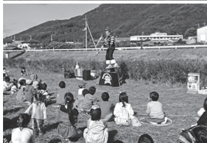
(宇和) 児童館のハロウィンパーティーで、大道芸人によるパフォーマンスの上演