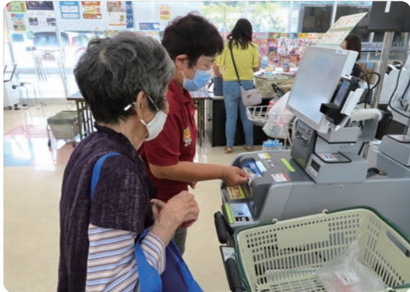
セルフレジの操作など、買い物支援のボランティア(デイサービス「陽より」)