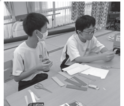
しいのき園で納涼祭の準備のお手伝い

参加者は高齢者や障がいのある方、小さい子供への思いやりなど福祉の心を育てるとともに、福祉の仕事への関心を高めることに繋がったようです。