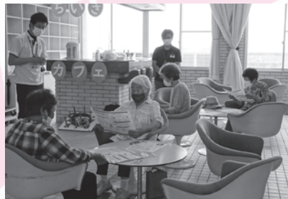
(明浜) 小さな地区単位で、その地域にお住まいの方を対象とした集いの場としてのカフェの開催