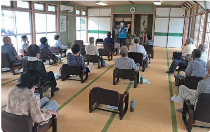
歯科衛生士さんに依頼して、健康づくりについての講座(河内いきいきサロン)