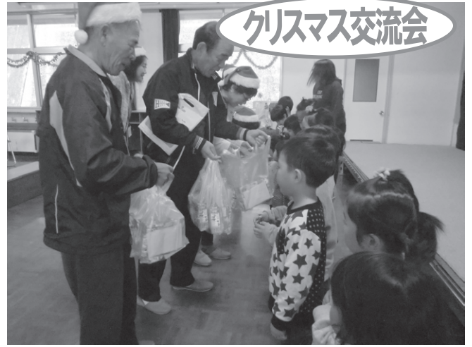
明浜地区の高山保育所では、園児と民生委員さんとのクリスマス交流会が開催されました。