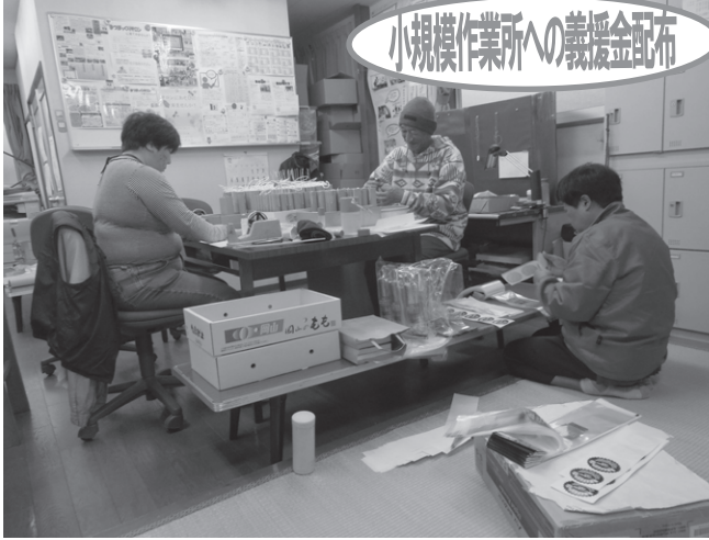
宇和地区にある「まつば共同作業所」「就労継続支援 B 型事業所 虹」に義援金をお届けしました。

「歳末たすけあい運動」は、共同募金運動の一環として地域住民やボランティア、民生委員・児童委員、社会福祉施設、社会福祉協議会等の関係機関・団体の協力のもと、新たな年を迎える時期に、支援を必要とする人たちが地域で安心して暮らすことができるよう、住民の参加や理解を得てさまざまな福祉活動を重点的に展開するものです。