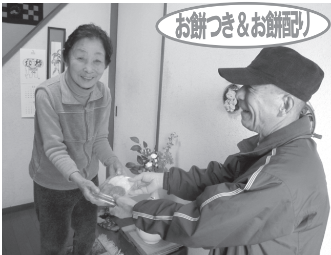
野村地区では、民生委員さんがお餅をつき、安否確認を兼ね独居世帯へお配りしました。