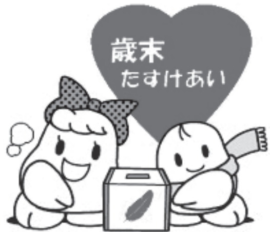
この他にも、市内・近隣施設へ特産品を、児童養護施設等へ義援金を送付しました。