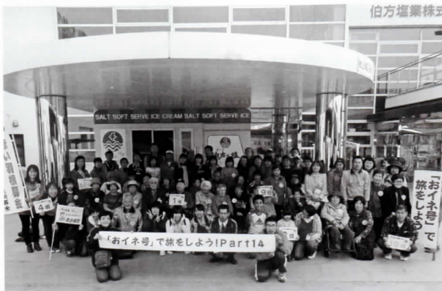
「伯方の塩」の工場前で記念写真

「おイネ号」ではボランティアする人・される人の隔たりはなく、同じ参加者として一緒に旅を楽しみます。お互いに交流を深めながら、旅を満喫されました。