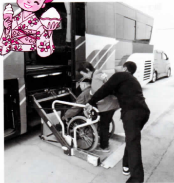
車いすの方も、リフト付きバスなので気軽に参加できます!